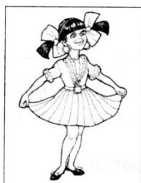
ПОХВАСТАТЬСЯ НОВОЙ ОДЕЖДОЙ