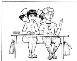
ВЫПОЛНЯТЬ ЗАДАНИЯ УЧИТЕЛЯ