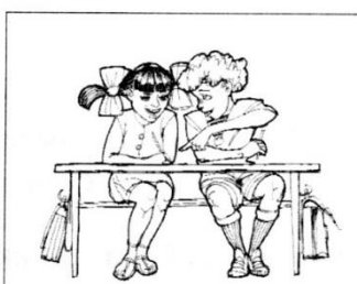
ДРУЖИТЬ С РЕБЯТАМИ